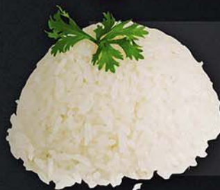
РИС ВСЕМ PEACE 200 г