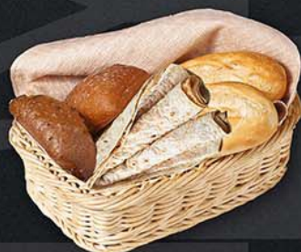
ХЛЕБНАЯ КОРЗИНКА ЛАВАШ 100 г — 80 ₺ — 2 БУЛОЧКИ 80/20 г — 69 ₺ — 4 БУЛОЧКИ 160/30 г — 109 ₺ — ЧИАБАТТА 100 г — 100 ₺ —