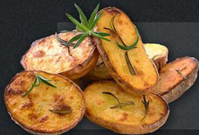
БЕЛОРУССКИЙ ШПИОН 200 г