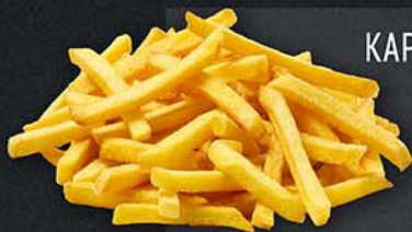
КАРТОФЕЛЬ "ВАН, ТУ, ФРИ" КАРТОФЕЛЬ ФРИ 150 г