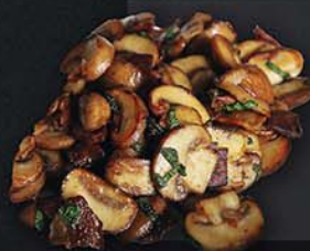
ЖАРЕННЫЕ ШАМПИньОНЫ С ЧЕСНОКОМ И ГРЕЦКИМИ ОРЕХАМИ 220 г