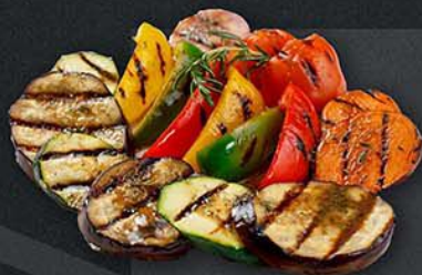
ОВОЦИ-ГРИЛЬ СЕЗОННЫЕ ЦУКИНИ, БАКЛАЖАНЫ, ТОМАТЫ, БОЛГАРСКИЙ ПЕРЕЦ 170 г