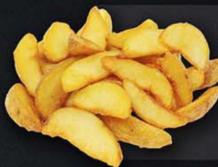
КАРТОФЕЛЬ "АЙ, НЕ ДАХО!" АЙДАХО / КАРТОФЕЛЬ ПО-ДЕРЕВЕНСКИ 150 г